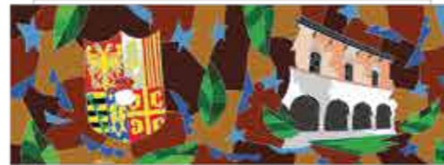
Marchesato del monferrato