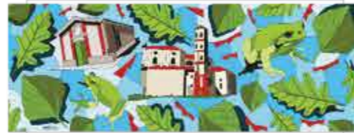
Bosco della partecipazione