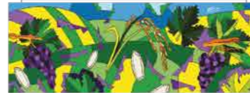
Unione comuni monferrato