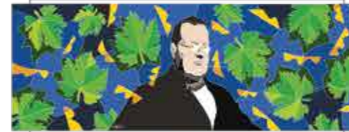
Camillo Benso Cavour